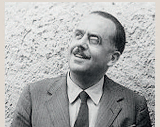
Achille Campanile, scrittore e umorista

L'appuntamento è nell'auditorium del liceo, in via Cinzio Violante, domenica 13 giugno, alle 20.