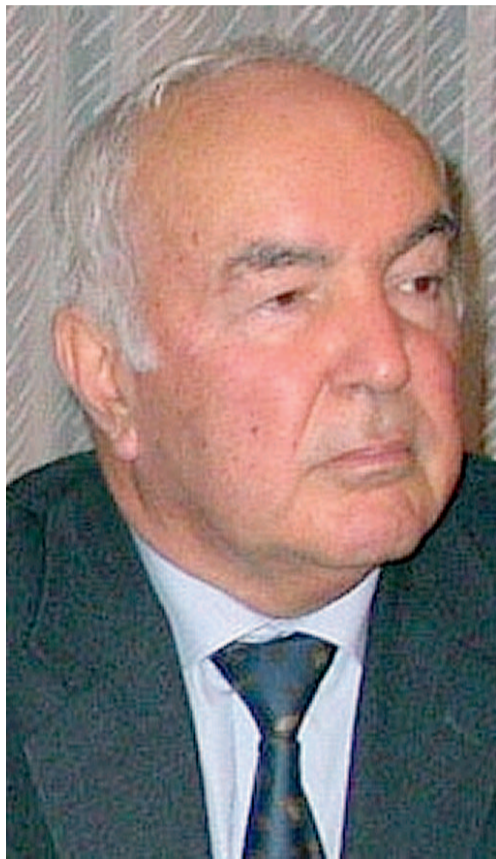
Gaetano Nanula, generale-scrittore

«È un racconto scritto con il cuore - ha sottolineato Nanula con il rimpianto che, finito il tempo degli impegni lavorativi, avremmo potuto dedicarci insie-